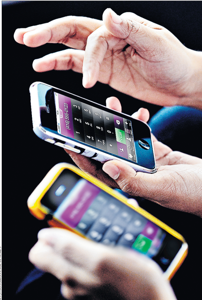
Viber propose des appels de qualité parfois supérieure à celle des appels via le réseau traditionnel.

Venons-en aux appels gratuits. Viber permet de téléphoner (sans changer de numéro) via Internet, donc sans utiliser le réseau classique, mais en empruntant, selon leur disponibilité, les réseaux Wi-Fi ou 3G. Bien sûr, la qualité est la meilleure lorsque les deux